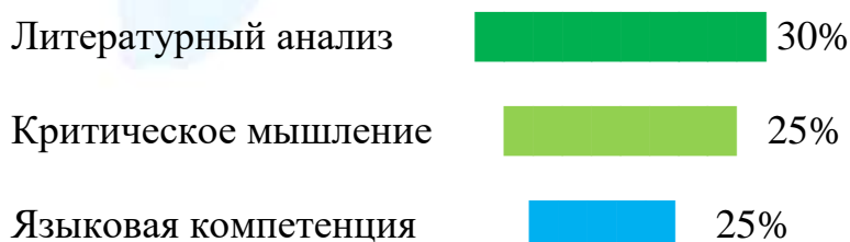
Диаграмма 3. Формирование компетенций студентов

Вывод: наиболее изучаемым жанром является роман в стихах, особенно Евгений Онегин.