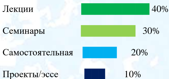
Диаграмма 1. Структура изучения пушкинского наследия в вузах

Вывод: основная нагрузка приходится на лекции и семинары, что обеспечивает теоретическую и практическую подготовку студентов.